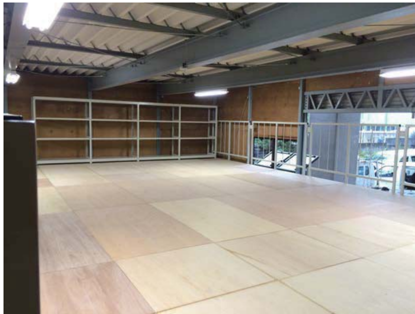
↑上層を平スペースとして使用